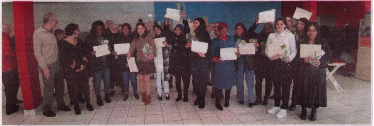
La dernière promotion de la formation à la citoyenneté du Secours catholique.

J eudi 9 mars dernier avait lieu la remise officielle des attestations de formation à la citoyenneté par le Secours catholique à quatorze personnes issues de presque autant de pays différents, notamment du Pakistan, d'Algérie, de Guinée, du Congo ou encore d'Azerbaïdjan, et toutes arrivées en France récemment.