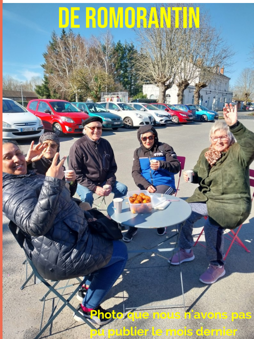
Photo que nous n'avons pas pu publier la mois dernier